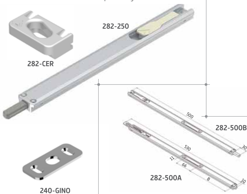
MEDIDAS (mm) Y ESQUEMA DE MONTAJE

Ref. 282-CER : Cerradero Superior regulable