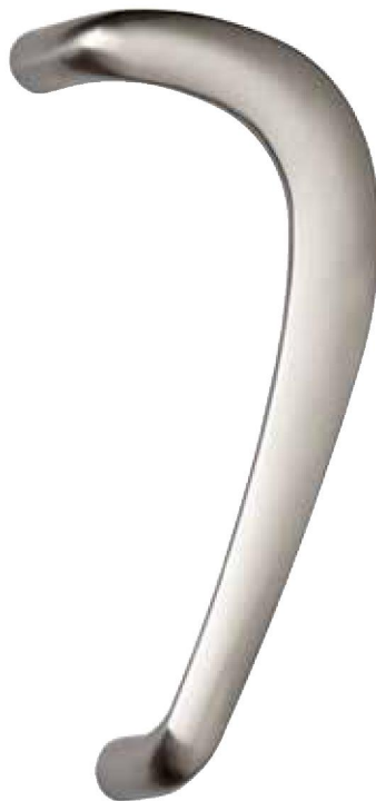
MEDIDAS (mm.) Y CENTRO DE TALACROS

7012: 2 unidades de derecha con accesorios para montaje por un lado de la puerta.