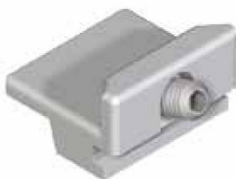
2700CSTMO0 – 2700 CERRADERO STANDARD