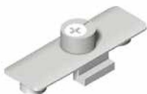
2600PCAC20 – PUNTO CIERRE ADICIONAL