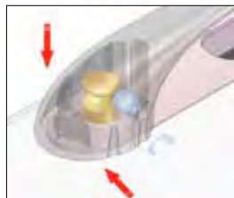
Système de fixation