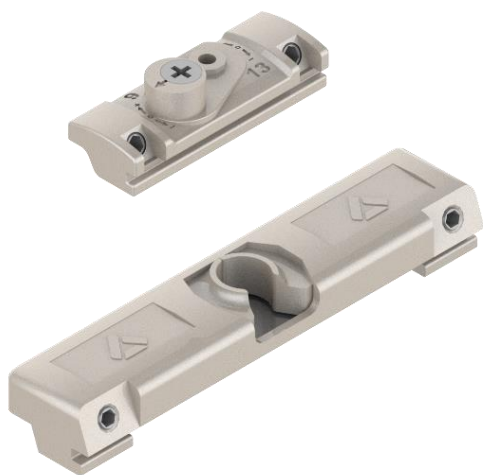
COLOCACIÓN Y ESQUEMA DE MONTAJE