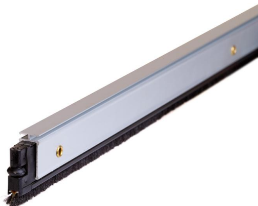
MEDIDAS (mm.) Y ESQUEMA DE MONTAJE

ALMA LOCK-2: disponible en 720 mm, 820 mm, 920 mm y 1020 mm.